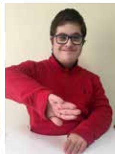
أندورا : وضع اليد بجانب الجسم، رفعها قليلاً ومن ثم إنزالها من الجهة الأخرى للإشارة إلى البحر المحيط بأندورا.