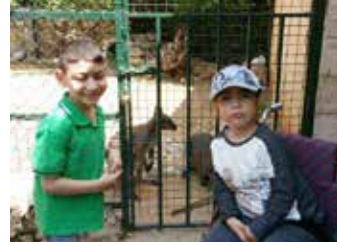
وحدة الإعاقة الجسدية

كان نهارنا حلو وصار فيكن تجوا لعنا ونحننا منخركن أكثر عن مميزات كل الحيوانات الي شفناها.