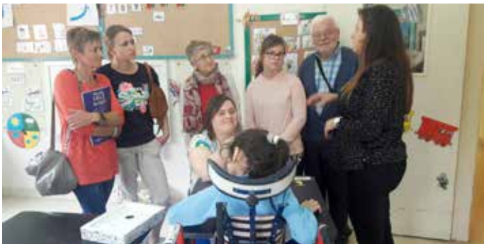
قسم الزوار والمنتطوعين