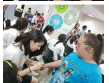
قسم الزوّار والمتطوعين

نشاطات هالشهر كثيرة، وزوّارنا مثل العادة بيشرفونا ليزرعوا البسمة على وجوه اولادنا.