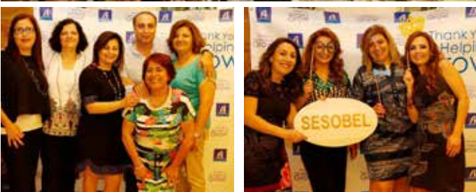
Département Plateau Technique