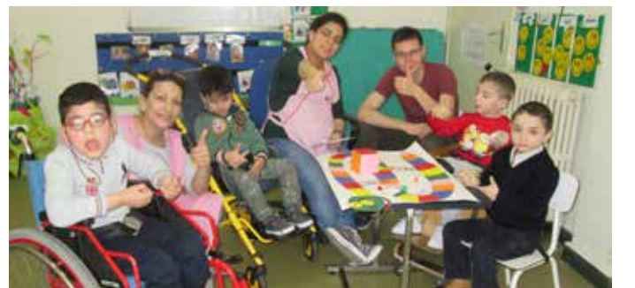
وحدة التدخل المبكر