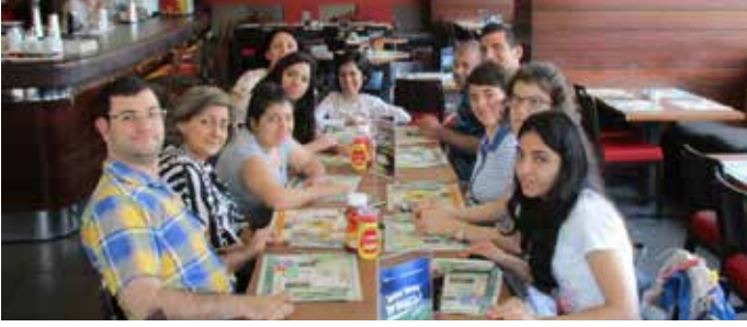
مركز المساعدة بالعمل