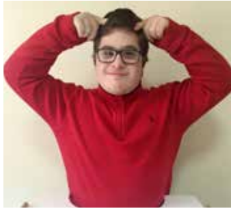
بريطانيا : وضع اليدين على الرأس للدلالة على التاج الذي تلبسه الملكة البريطانية.

مرحباً، بهيذا العدد من همزة وصل، رح نعرّفكن على الإشارات يليّ بتتعلّق بالبلدان يليّ عم يكتشفوها ولادنا بكلّ البرامج التربويّة خلال هالسنة.