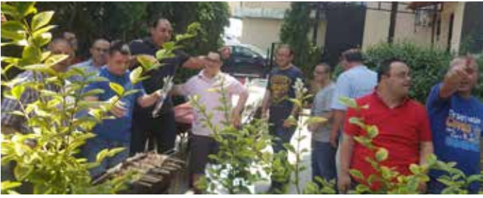
مركز المساعدة بالعمل