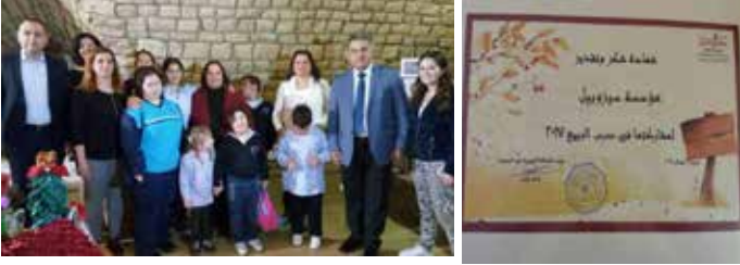
برنامج الدمج المدرسي - سيزوبيل جزين