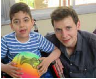
Enfants et Equipe de L'U.S.P

MERCI! Nous avons été très touchés par ta généreuse participation, ton support, ton sourire et ton approche très remarquable auprès de nos enfants et de l'équipe. MERCI d'avoir été à nos côtés ! Sincèrement.