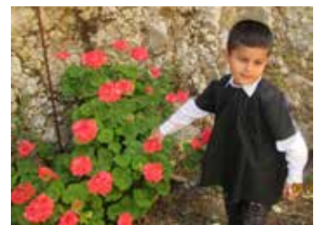
وحدة التدخل المبكر