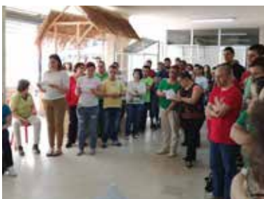
دولي غريشي - Ambiance de vie

كما وأنو الشبيبة اشتروا بالصلاة لختام الشهر المقدّس مع قسمي الإنتاج والتسويق على مدخل مبنى "سيدة الإيمان"، فكان الفرحة السماوي عمّ يعمّ بالأجواء.