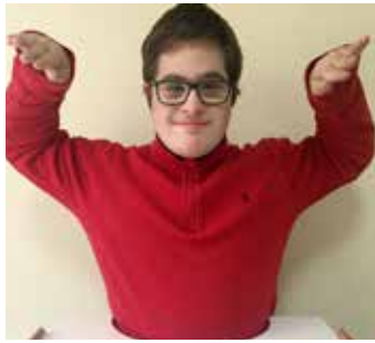
المكسيك : وضع اليدين بجانب الرأس، الكفّين نحو الأسفل. إبعادهما عن الرأس وفتح الكفّين نحو الخارج للإشارة إلى قبعة المكسيكيين الكبيرة.