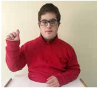
أرمينيا : وضع اليد جانب الجسم، فتح الكفّ وإغلاق الأصابع قليلاً للإشارة إلى شكل فاكهة الرمان. إقفال الأصابع وجمع السبابة والأبهام للدلالة إلى الحبوب في هذه الفاكهة. يذكر أنّ الرمان يشكّل رمزاً أساسياً في أرمينيا.