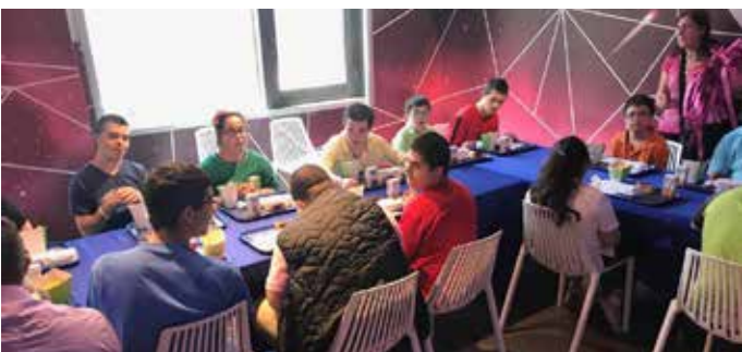
وحدة الإعاقة الفكرية